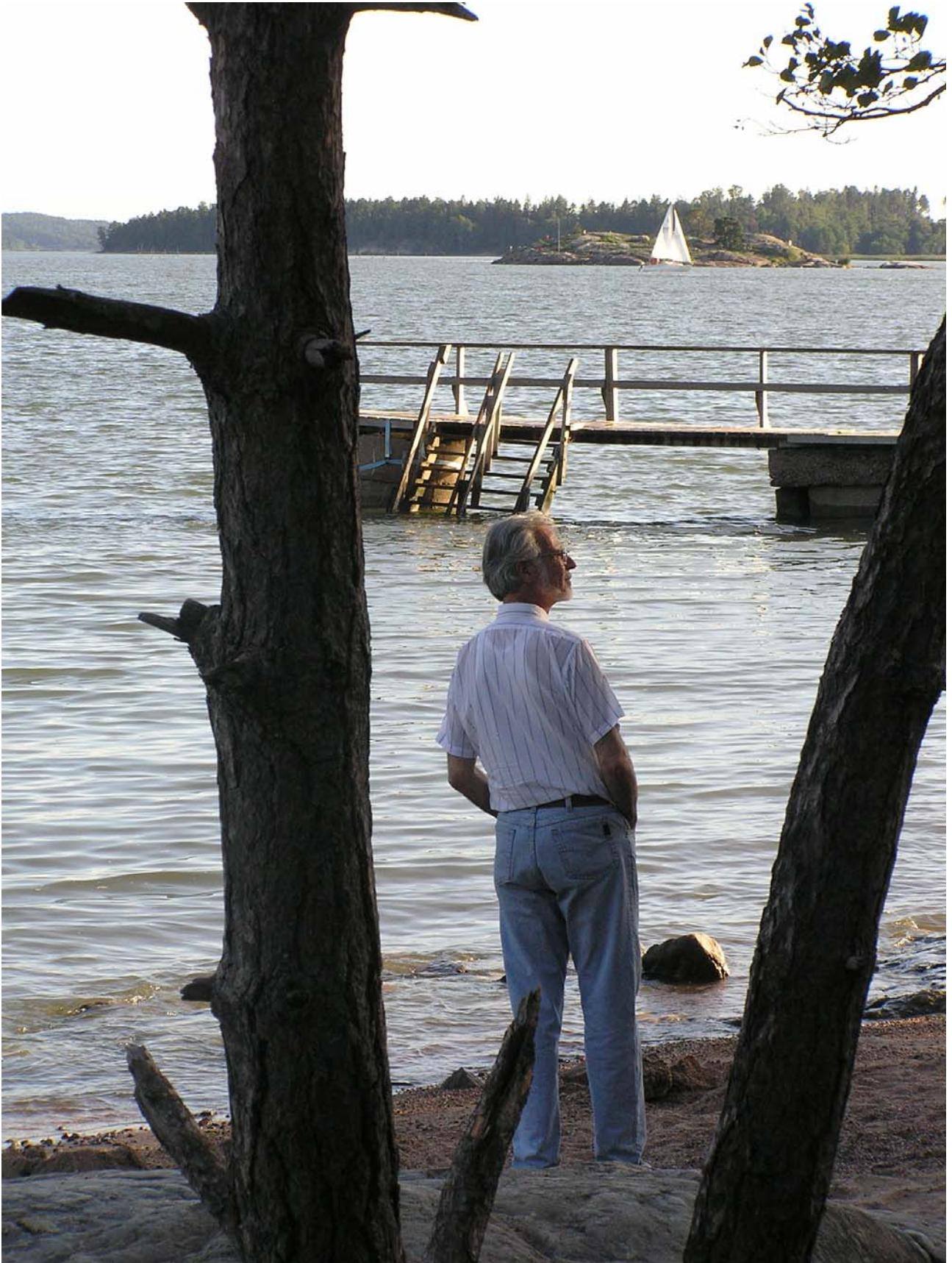
Ruissalossa merta ja maisemia ihaiemassa.