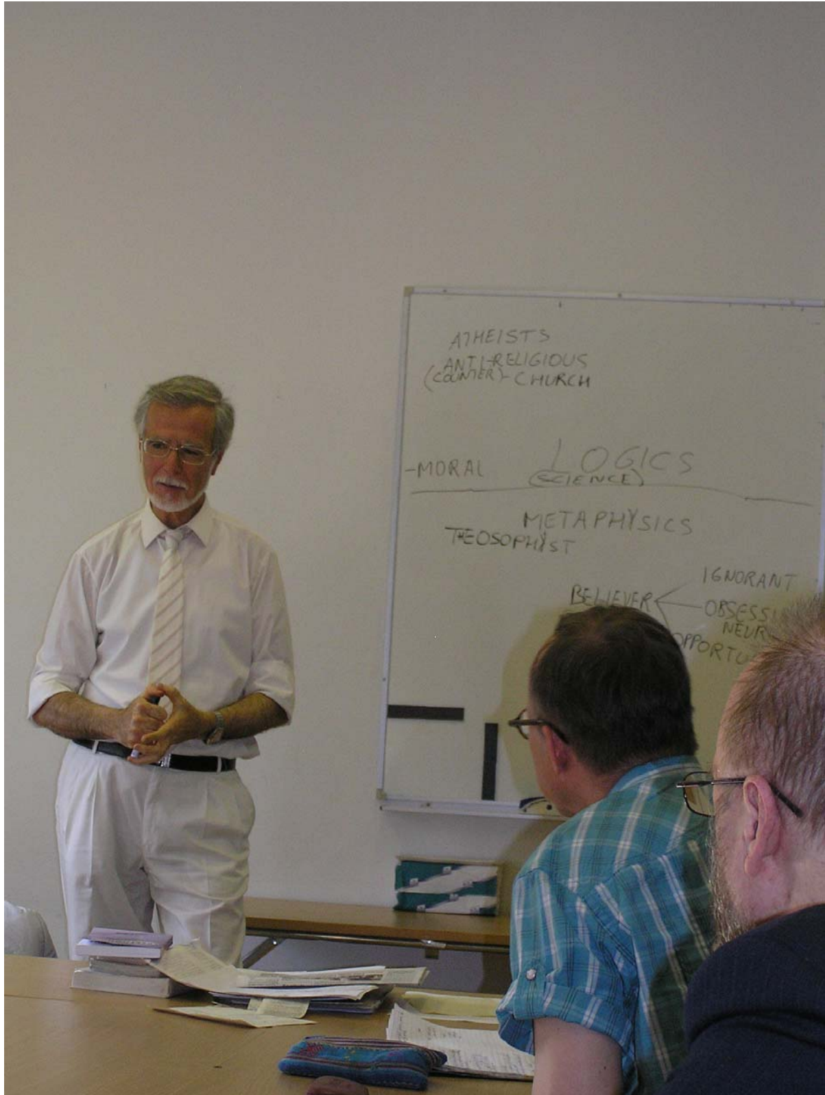
Esitelmä- ja keskustelutilaisuus ateismista.

Alustus alkoi ruotsalaisessa sanomalehdessä julkaistuilla lasten ajatuksilla mm. Jumalasta ja Jeesuksesta. Koska lapsilla ei ole obsessiivista (pakkomielleistä) neuroosia - mikä onkin uskonnon oikea nimi - heidän ajatuksistaan käy hyvin ilmi, että ihminen luo Jumalan. Mm. noin 9-vuotiaan lapsen ajatukset ”Ennen Jumalaa oli jo Jeesus, joka oli kristitty” ja ”Kun viini oli ravintolasta loppunut, Jeesus teki sielläkin vettä ja viiniä”, hieman huvittavat meitä. - Niin ne huvittivat jo antiikin Epikurosta.