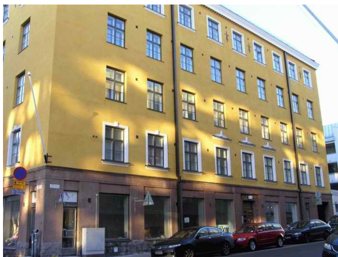
Albertinkatu 6, talo, jossa Väinö Voipio asui eläkepäivinään.

Vapaa-ajattelijain liiton kultainen ansiomerkki Voipiolle myönnettiin hänen 85-vuotispäivänään 11.12.1969 (VAJ 1969:8, 191; VAJ 1971:3, 71). Myöhemmin hänet kutsuttiin liiton kunniapuheenjohtajaksi (VAJ 1971:3, 71; VAJ 1971:5, 113).