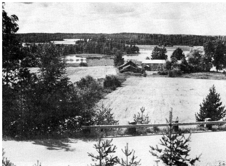
Näkymä Nikin tilalle.